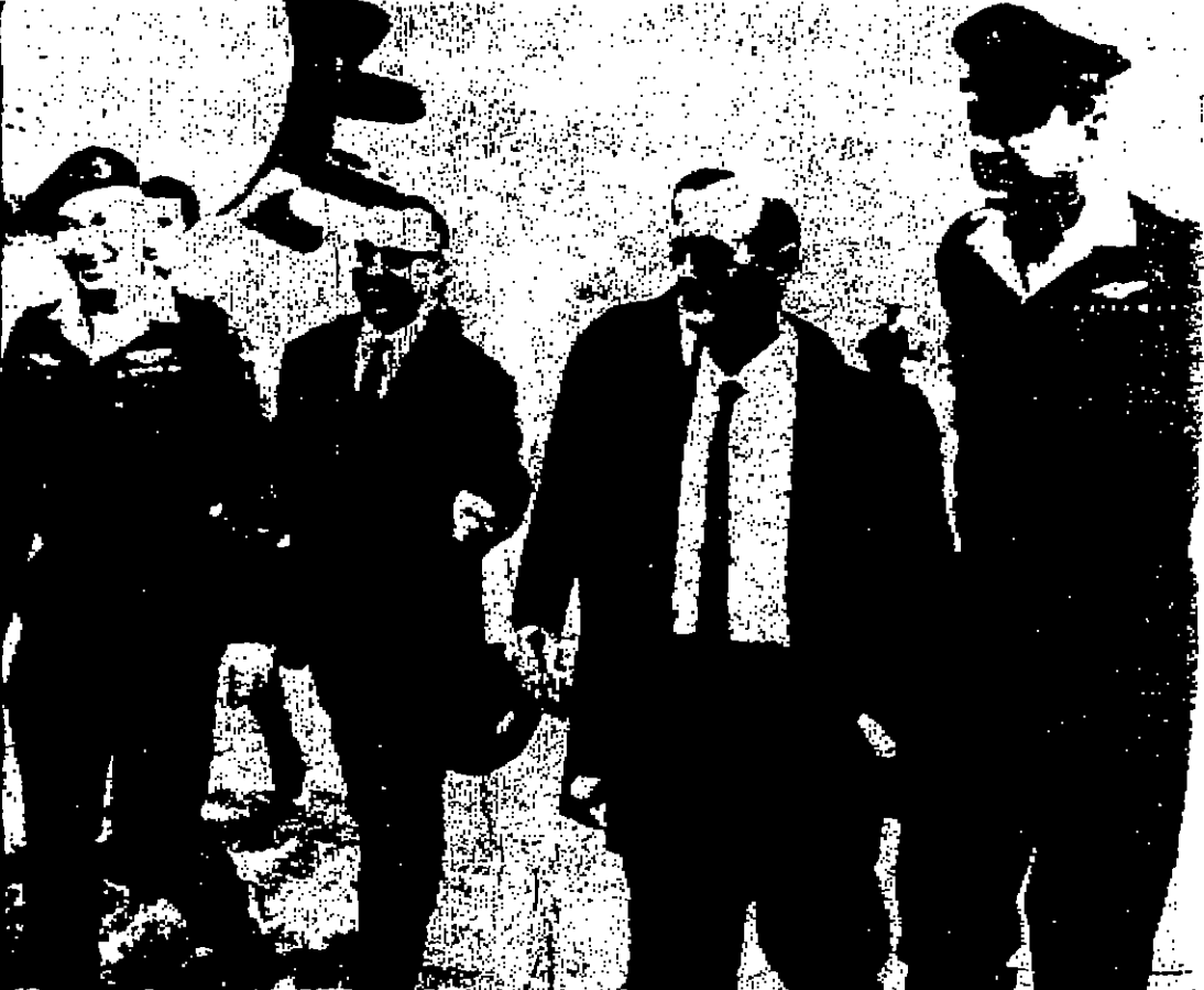
موشيه دايان وزير الدفاع الاسرائيلي يرفقه الى الطائرة لدى سفره الى نيويورك امس ويرى معه في الصورة هاسم بلوف رئيس اركان جيش اسرائيل وزي تسور والي يساره ايزر وايزمان من فلة الجيش المحل

سان فرانسيسكو - رويتر - اهل رجال البوليس فريا بالهراوات على سيقان متظاهرين في محاولة لتفريق مسيرة احتجاج اشركت فيها الفسدة وخمسائة طالب في كلية الالوية في سان فرانسيسكو اول امس. واعتل عشرة اشخاص على الاقل خلال المسرة. واخذ الطلاب يوشقون الحجارة والاشدات على رجال البوليس فنيا هلموا اشترنك بالمسرة لاعتقل شخص. وبعد ذلك تحرك رجال البوليس تقريق المتظاهرين. ولا يزال الطلاب المتظاهرين في الكلية التي تضم ١٨ الف طالب مخرجين منذ خمسة اسابيع. وهم يرددون اغاني الكنية حتى لم الاستجابة الى مطلب الزنوج وامضاء الاضليات الاخرى. ورشق بعض المتظاهرين مسيرة للبوليس بالحجارة وهلموا هقلية كوربالية وانقل رجال البوليس من الكلية لعصابة المملة.